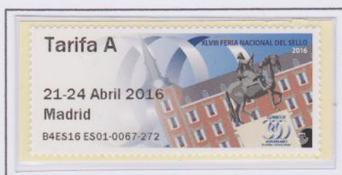
Mod. Caballo. Tarifa A