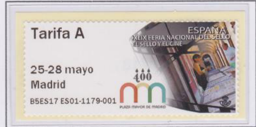
Mod. Película Tarifa A

La temática de la FERIA Nacional del Sello fue sobre el cine, con el eslogan 'Una FERIA de Cine'. En los dos modelos aparecidos se puede ver como ambos motivos se envuelven en una claqueta y un rollo de película.