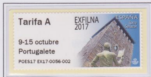
Mod. Torre Salazar Tarifa A