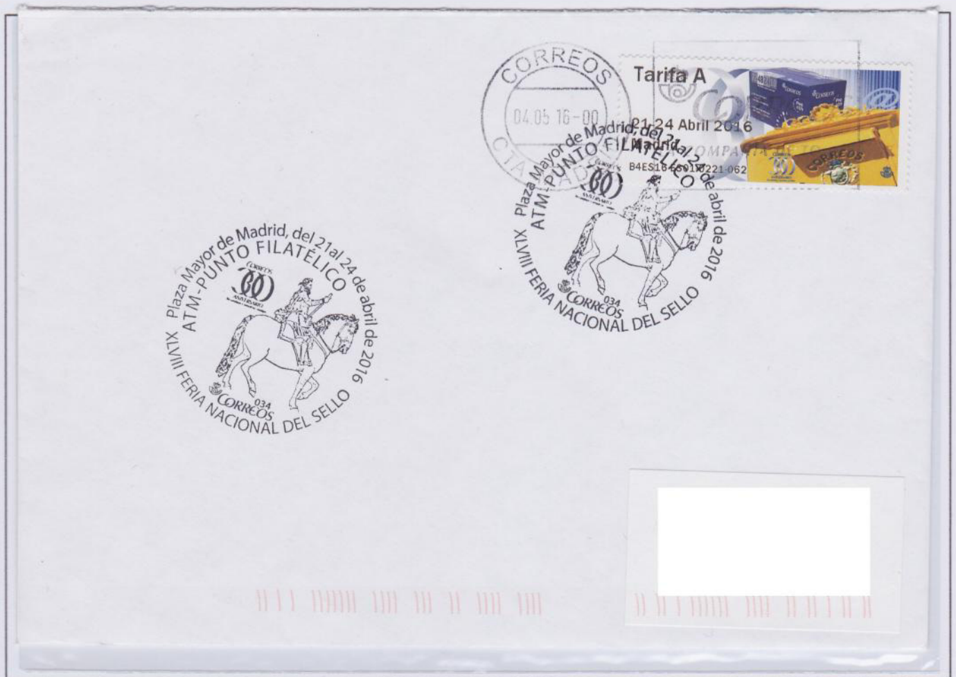
Sobre depositado el 22 de Abril en la Feria del Sello del 2016 y enviado el 4 de Mayo cuando pasó por el CTA anulándolo doblemente. La tarifa es correcta usando la etiqueta de tarifa A del modelo 'Buzón' v el matasellos exclusivo para etiquetas.

Tardaron en llegar aproximadamente quince días y el resultado no pudo ser más nefasto, todos los envíos pasaron por el CTA con el consiguiente doble matasellado. No pudieron tener peor comienzo las etiquetas. Aún así, Correos quiso de alguna manera recompensar a las personas que usaron el servicio y a quien lo solicitara se le enviaría de nuevo los sobres con las etiquetas y matasellados, aunque en este caso para evitar que volviesen a pasar por el CTA los enviaron en otro sobre colector.