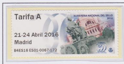
Mod. Cibeles. Tarifa A