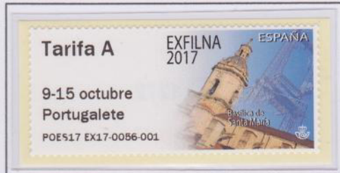
Mod. Basílica de Santa María Tarifa A

Como anécdota podemos comentar que en las imágenes que Correos tiene del modelo de la Basílica de Santa María, aparece como Iglesia de Santa María. Una corrección a tiempo, puesto que, en 1951, el 27 de febrero, el Papa Pío XII otorgó a la iglesia el rango de basílica menor.