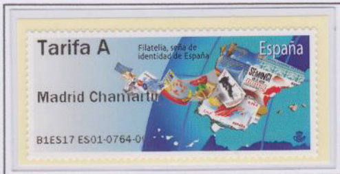
Mod. Filatelia Tarifa A

Los primeros dos modelos llevan como nombre 'Filatelia' y 'Turismo' y se pueden leer las leyendas 'Filatelia, seña de identidad de España' y '2017. AÑO INTERNACIONAL DE TURISMO SOSTENIBLE PARA EL DESARROLLO' respectivamente.