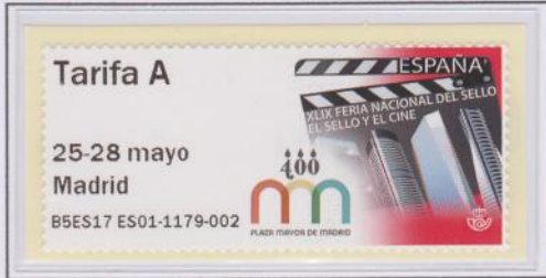
Mod. Claqueta Tarifa A

En un principio la XLIX FERIA Nacional del Sello se iba a celebrar del 1 al 4 de junio, pero en esas fechas se realizaron algunos actos del IV Centenario de la Plaza Mayor de Madrid y la Feria tuvo que adelantarse una semana, del 25 al 28 de mayo.