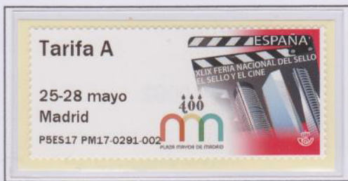
Mod. Claqueta Tarifa A

Los cambios de esta Feria los encontramos en la matrícula. Como se puede observar, ahora la matrícula queda: P5 ES17 PM17-(SESIÓN)- (NÚMERO DE ETIQUETA).