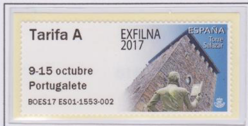
Mod. Torre Salazar Tarifa A

La Exfilna del 2017 se celebró en Portugalete, Vizcaya entre los días 9 a 15 de octubre. Los dos modelos emitidos tenían imágenes tomadas por Nuria Revilla. El primer modelo donde se ve la Torre Salazar y el monumento a Lope García de Salazar. En el segundo aparecen la Basílica de Santa María y el Puente Colgante al fondo.