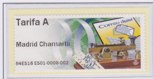
Mod. Telégrafo Tarifa A