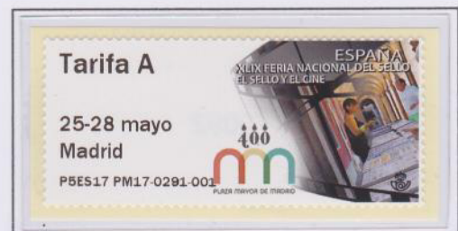
Mod. Película Tarifa A

La letra B inicial se cambia por la P para indicar que es la del mostrador y el ES01 que indica la máquina táctil cambia por PM17, que significa Plaza Mayor y el año, para así indicar el lugar donde se imprimen las etiquetas. Estos cambios será el criterio a seguir a partir de ahora en las sucesivas exposiciones en donde aparezcan nuevos modelos.