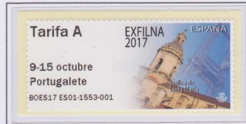
Mod. Basílica de Santa María Tarifa A

Incomprensiblemente, el Puente Colgante queda relegado a un segundo plano, cuando lo más representativo de Portugalete es precisamente el puente, Patrimonio de la Humanidad de la Unesco desde el 2006.