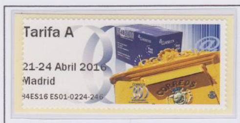
Mod. Buzón. Tarifa A