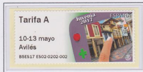
Mod. Videojuego Tarifa A (mostrador)

Detalles ampliados de la impresión térmica de las etiquetas impresas en el mostrador y la táctil respectivamente. Se ve a simple vista el efecto sierra en la tipografía, por tanto, una mejor definición en la del mostrador.