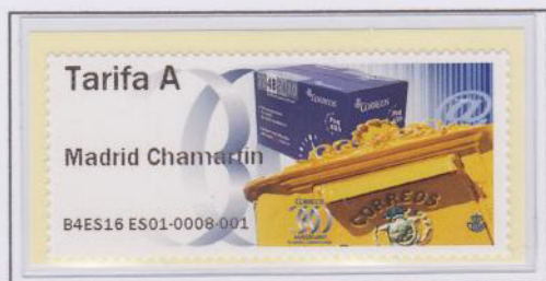
Mod. Buzón Tarifa A

Se repiten los modelos 'Buzón' y 'Telégrafo'.