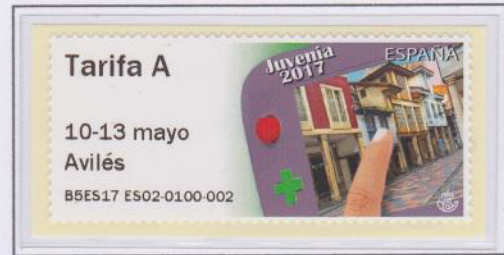
Mod. Videojuego Tarifa A