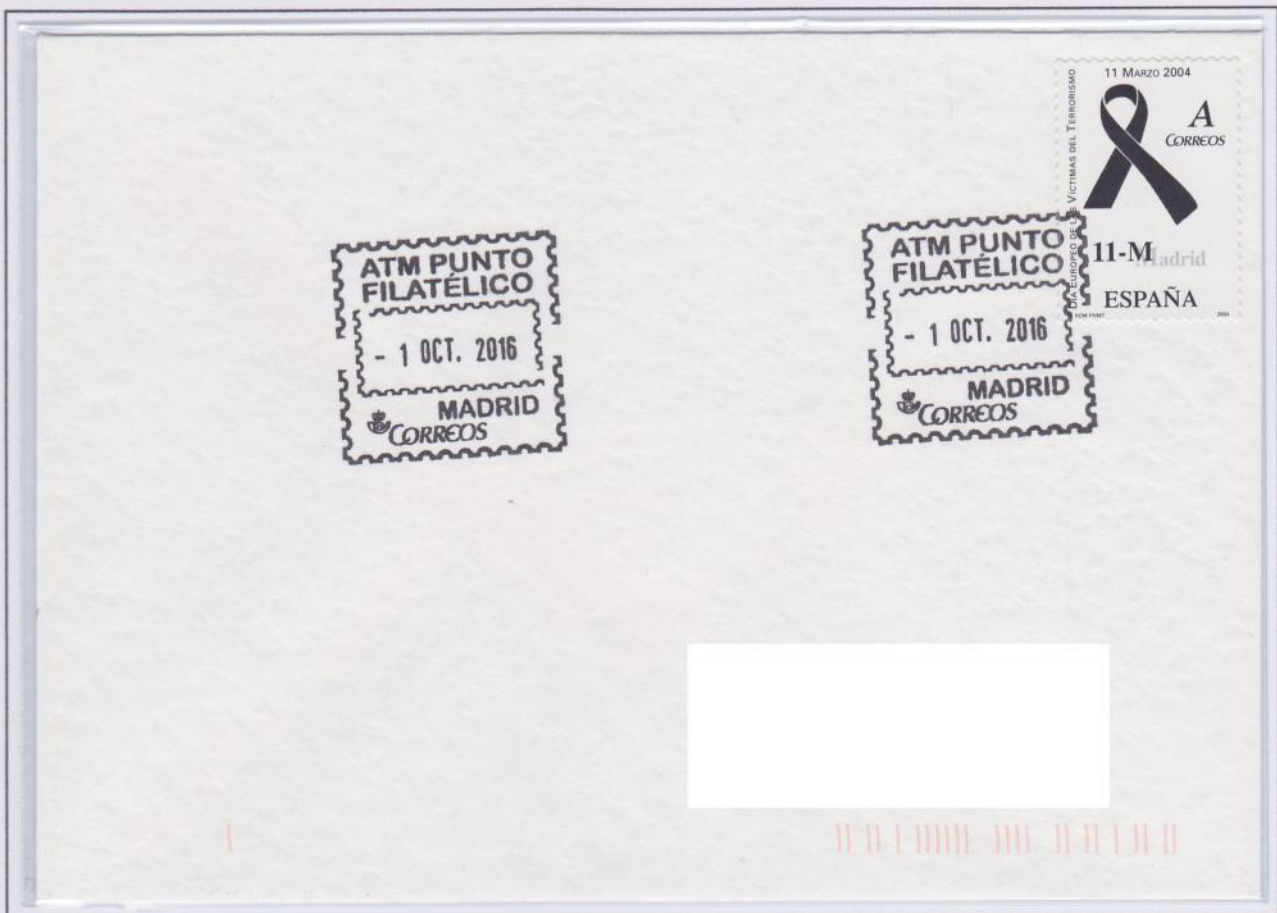
Sobre enviado desde el CCP Chamartín usando el matasellos exclusivo para las etiquetas. La carta lleva un sello de tarifa A conmemorativo correspondiente al envío de una carta hasta 20 gramos, por tanto, es un mal uso del matasellos.

Se denomina turístico porque en la actualidad tienen un diseño similar los que están apareciendo, pero no deja de ser un matasellos especial como otros que tiene el Servicio Filatélico u otros departamentos.