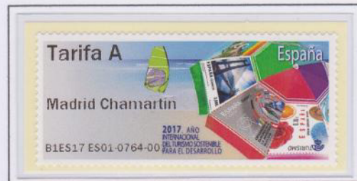
Mod. Turismo Tarifa A