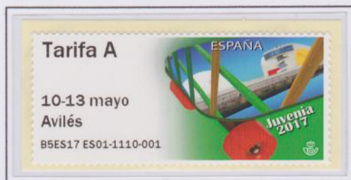
Mod. Patín Tarifa A (táctil)