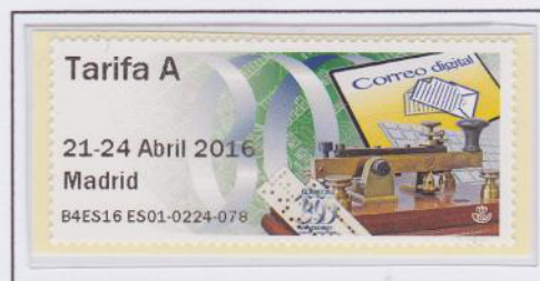
Mod. Telégrafo. Tarifa A