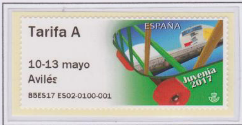
Mod. Patín Tarifa A

En lo que respecta a las etiquetas aparecieron dos nuevos modelos, Patín y Videojuego, acordes con la exposición y su ambiente juvenil.